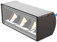
ULTIMATE Scheinwerfer/ headlight (#223-082/#223-083)

4 x M4 Gewinde zur Befestigung des Gehäuses 4 x M4 thread for housing installation