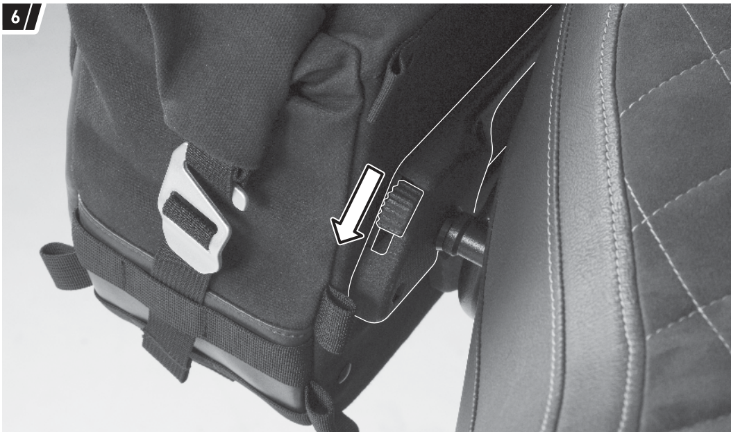
Befestigung und Fahrzeug dienen als Beispiel. / Fixation and vehicle are examples.

Drücken Sie zum Entriegeln der Seitentasche (1a/1b) einfach den gezeigten Schieber des Verschlussmechanismus nach unten.