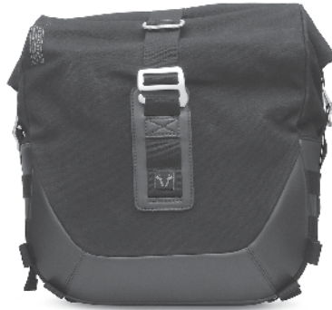
1b 1x Seitentasche LC2 Side Bag LC2 BC.HTA.00.402.10+00 L / R