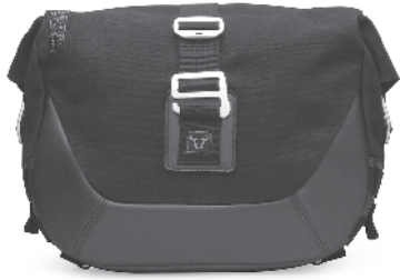
1a 1x Seitentasche LC1 Side Bag LC1 BC.HTA.00.401.10+00 L / R