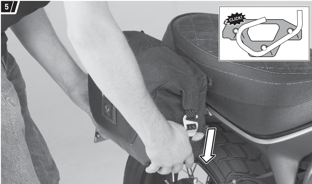
Befestigung und Fahrzeug dienen als Beispiel. / Fixation and vehicle are examples.

Drücken Sie anschließend die Seitentasche (1a/1b) leicht nach unten, bis diese fest am SLC Seitenträger sitzt.