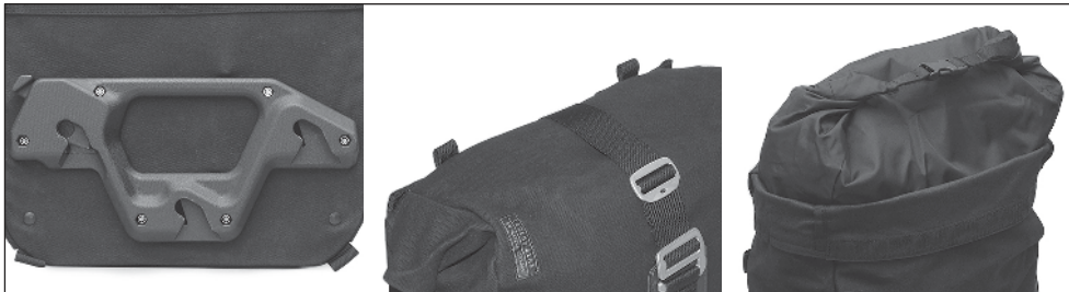
Features (von links nach rechts): Schnellverschluss-System; Laschen für den Schultergurt (separat erhältlich); Wasserdichte Innentasche. Features (from left to right): Quick release fastening system; Loops for the shoulder strap (sold separately); Waterproof Innerbag.