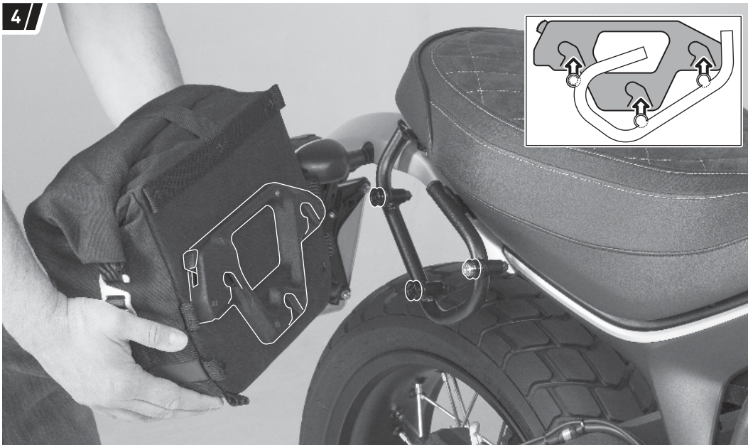
Befestigung und Fahrzeug dienen als Beispiel. / Fixation and vehicle are examples.

Setzen Sie die drei Öffnungen des Schnellverschluss-Systems auf die Aufnahmebolzen des montierten SLC Seitenträgers.