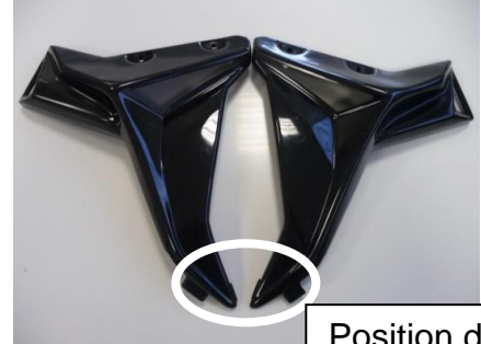
Position des Kantenschutzes