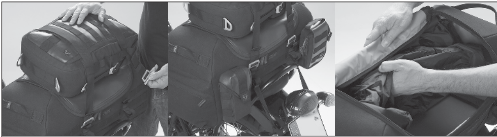
Features (von links nach rechts): Befestigungsgurte; Anbringungsmöglichkeit von zusätzlichem Gepäck; Wasserdichte Innentasche mit Klettbefestigung. Features (from left to right): Mounting straps; Attaching possibility for additional luggage; Waterproof innerbag with Velcro fixation.