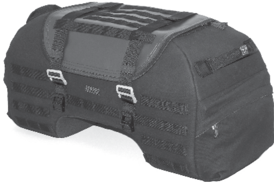
1 1x Hecktasche LR2 Tail Bag LR2